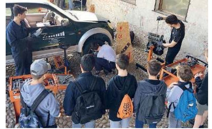
Da vicino. C'è anche la possibilità di fare visite guidate