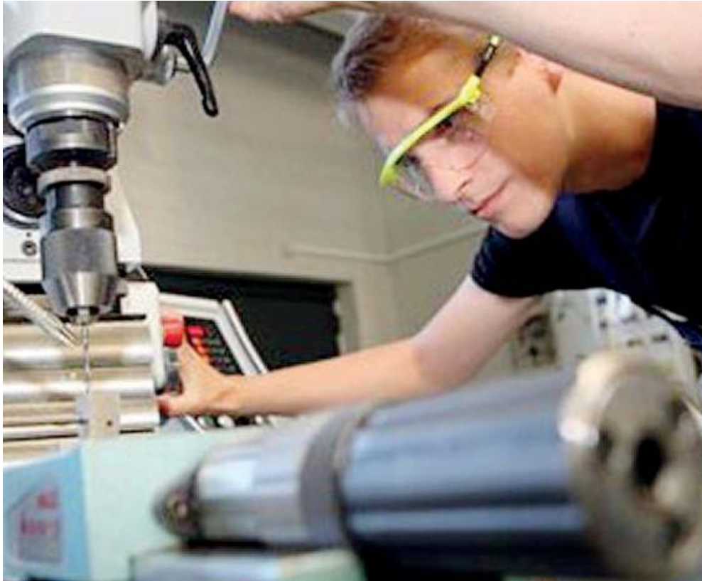
Dritti verso il lavoro. Sono molti gli sbocchi per chi sceglie la formazione professionale