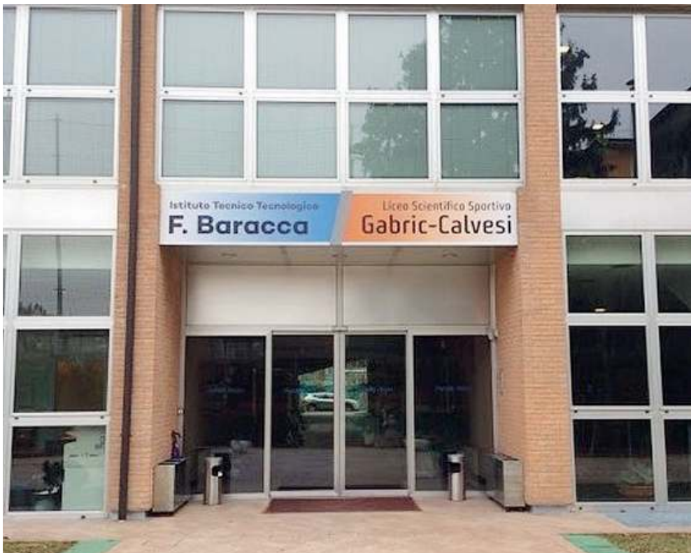
Dove. La sede è in via Monsignor Fossati, come quella dell'Istituto Francesco Baracca