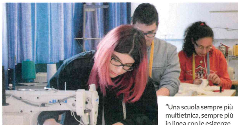
GLI STUDENTI DI SCUOLA BOTTEGA ARTIGIANI

Scuola Bottega Artigiani allarga la sua offerta formativa con nuovi orizzonti, guardando sempre a quelle che sono le richieste del mercato