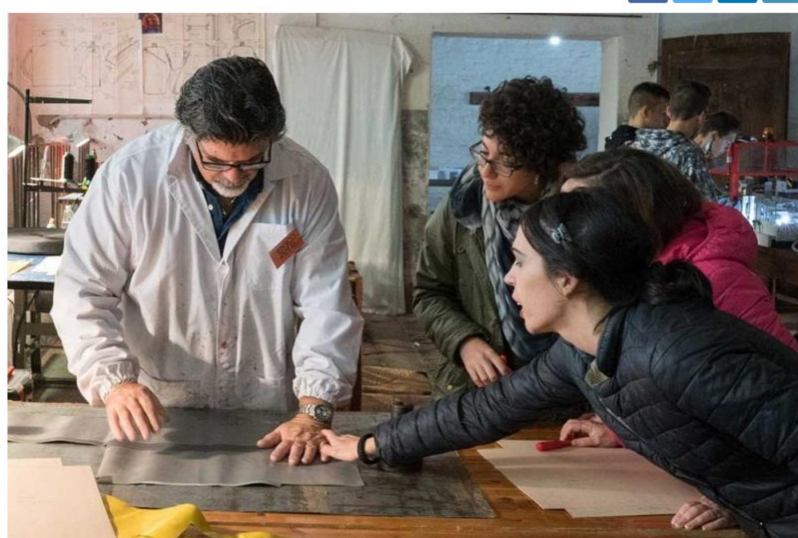
I ragazzi al lavoro a Padernello, durante il progetto «Oltre il borgo»

Perché scegliere la Scuola Bottega Artigiani ? Lo raccontano al GdB gli studenti e gli insegnanti, ma anche i titolari delle aziende, che condivideranno le loro esperienze di Alternanza Scuola Lavoro .